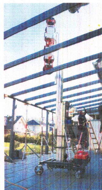
Option pose de verrière